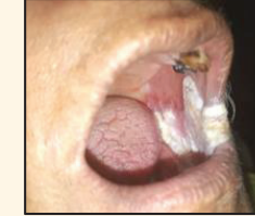
வெள்ளை நிற திட்டுக்கள்

வலி இல்லாத அகற்ற முடியாத வெள்ளை நிற அல்லது சிவப்பு நிற அல்லது வெள்ளை மற்றும் சிவப்பு நிறம் கலந்த திட்டுக்கள்