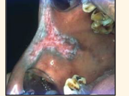
வெள்ளை மற்றும் சிவப்பு கலந்த திட்டுக்கள்