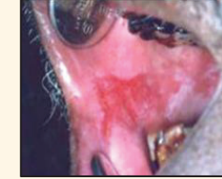
சிவப்பு நிற திட்டுக்கள்