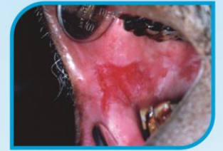
කල් පවතින රතු ලප