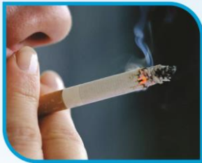
දුම්පානය (සිගරට්, බීඩ්, සුරැට්ටු)