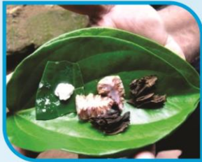
බුලත් වීට සැපීම