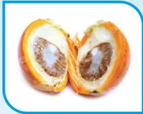
පුවක් සහ පුවක් පැකට් සැපීම