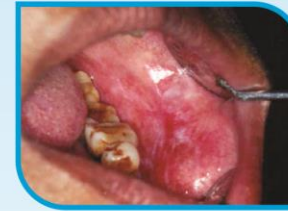
කල් පවතින සුදු සහ රතු මිශ්‍ර ලප

මුඛයේ අසාමාන්‍ය දැවිල්ලක් සමග තොල් සහ ශ්ලේෂ්මලයේ සහ විමක් සහ සුදුමැළි විමක්