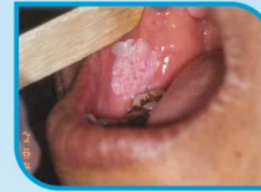
කල් පවතින සුදු ලප