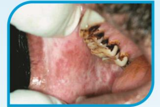
කාලයක් පවතින සුව නොවන තුවාලයක්

මුඛයේ අසාමාන්‍ය දැවිල්ලක් සමග තොල් සහ ශ්ලේෂ්මලයේ සහ විමක් සහ සුදුමැළි විමක්